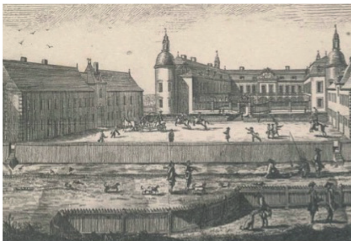
Une vue du château vers 1760 : les grilles se trouvaient encore au-delà des douves, elles délimitaient la cour d'honneur

Elle date en partie de la fin du XVII e siècle, période à laquelle Claude de Thiard, seigneur de Pierre, a reconstruit le château. Elle ne se trouve pas à son emplacement initial, comme le montrent des estampes et des plans anciens : à l'origine elle limitait la cour d'honneur et comprenait une partie centrale incurvée. C'est à la fin du XVIII e siècle que l'accès au château a été modifié : la grille a alors été reculée au-delà des communs et de la basse-cour.