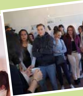
5 femmes du PLIE : réalisation du mobilier en bois et de la confection de tissus d'ameublement dans le cadre d'un chantier d'insertion de 2 mois, en collaboration avec l'Atelier du coin et la Régie de quartiers Bassin Minier de Montceau.