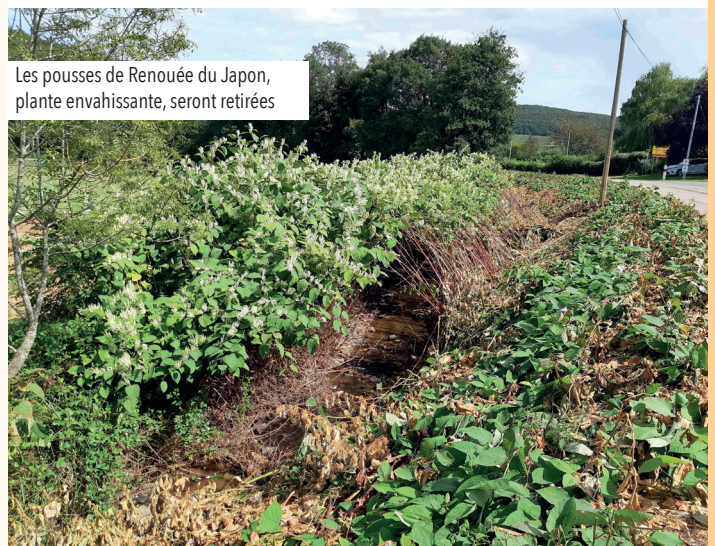
Les pousses de Renouée du Japon, plante envahissante, seront retirées

La loi du 18 juillet 1985 relative à la préservation de la qualité des sites, des paysages et des milieux naturels, aujourd'hui inscrite dans le Code de l'urbanisme sous l'article L142, donne compétence aux Départements pour élaborer et mettre en œuvre une politique de protection, de gestion et d'ouverture au public des espaces naturels sensibles.