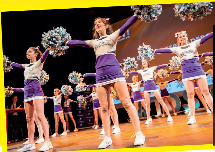
Démonstration de Cheerleading par l'association des Cheerleaders