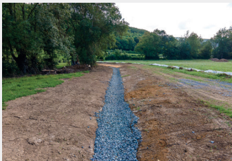
Préparation du nouveau lit