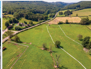
Définition du périmètre