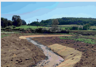
Première mise en eau

Une fois le tracé théorique établi, les pelleteuses ont pu se mettre à l'ouvrage, préparant pas à pas le nouveau lit.