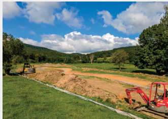
Premiers coups de pelle