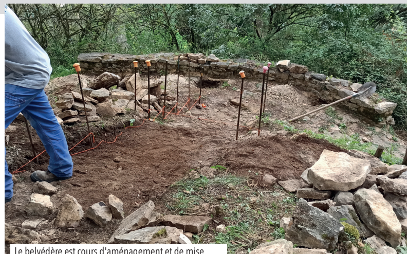
Le belvédère est cours d'aménagement et de mise en sécurité dans le respect de l'environnement naturel

Les deux sentiers de balade des Buis et des Ours, gérés par la commune d'Azé et mitoyens au parcours ENS, permettant une balade hors du temps dans un environnement protégé témoin de l'histoire, seront prochainement réhabilités.