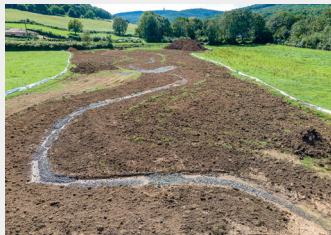
Les méandres reconstitués

Une fois le tracé théorique établi, les pelleteuses ont pu se mettre à l'ouvrage, préparant pas à pas le nouveau lit.