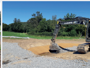
Construction de passages à gué