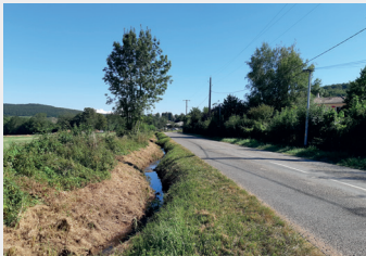
Avant la Mouge longeait la RD15