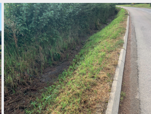
L'ancien lit sera remblayé