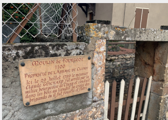
La plaque du Moulin Fourgeot, un vestige